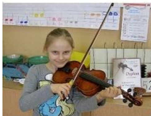
Uczennica II klasy naszej szkoły